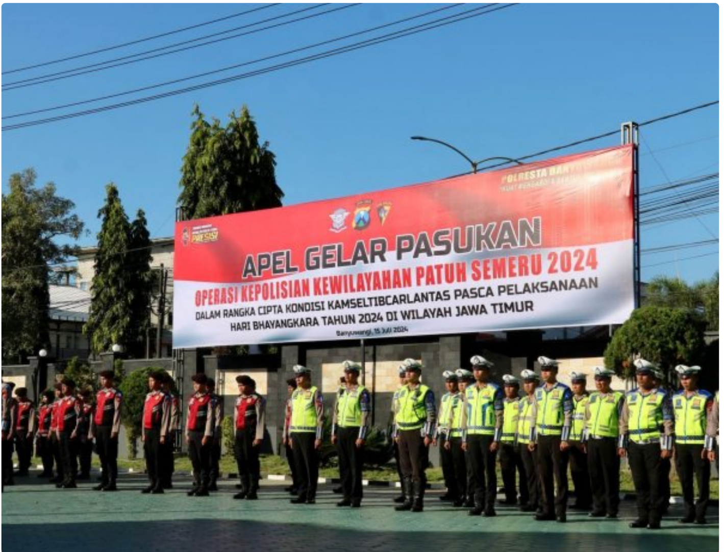
Apel Gelar Pasukan Ops Patuh Semeru 2024 di halaman apel Mapolresta Banyuwangi

BANYUWANGI – Untuk meningkatkan kesadaran dan kepatuhan tertib berlalu